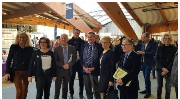
Inauguration avec les élus de la Région AURA et de la Ville de Saint-